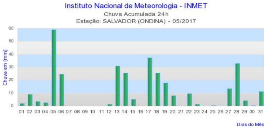
Figura 3 – Chuvas diárias, Salvador/Ba – maio/2017