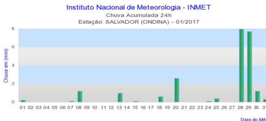
Figura 2 – Chuvas diárias, Salvador/Ba – janeiro/2017